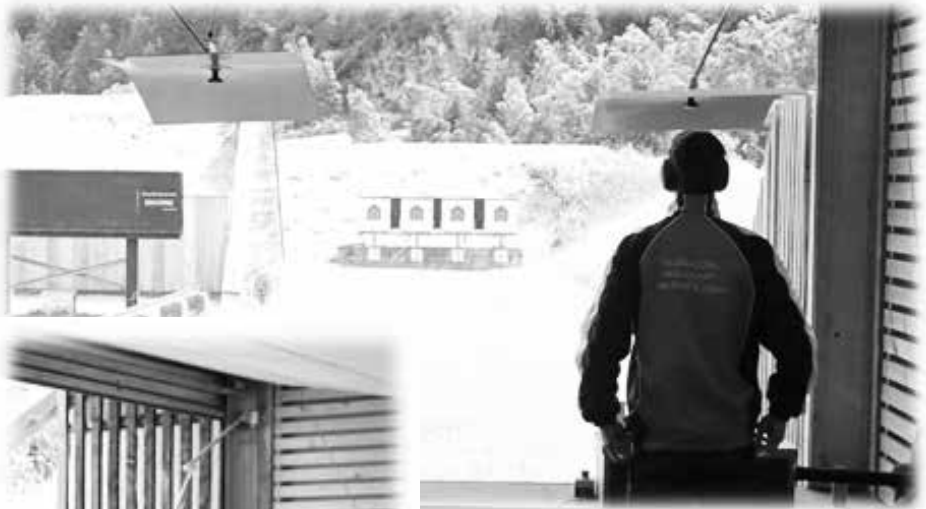
Persönliche Einstimmung in den Wettkampf

Hier galt es nun vor allem für unsere drei „Frischlinge“, ihre spürbare Nervosität ab-zu-legen oder wenigstens etwas besser in den Griff zu bekommen. Denn jeder dieser Drei wollte natürlich am liebsten gleich bei der Ersten Teilnahme die begehrte Calvenkanne gewinnen.