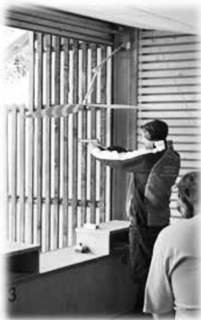
Volle Konzentration bei der Schussabgabe