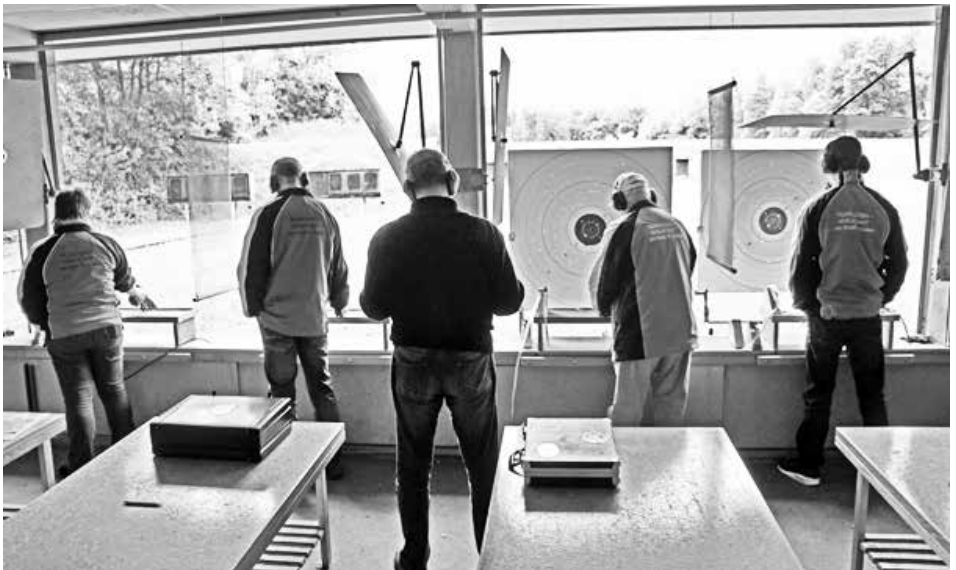
Vier Feldschützen im Pistolenstand

Wir haben einen sehr schönen Wettkampf erlebt und genossen und abschliessend den ausgezeichneten Zvieri bei einem Bier.